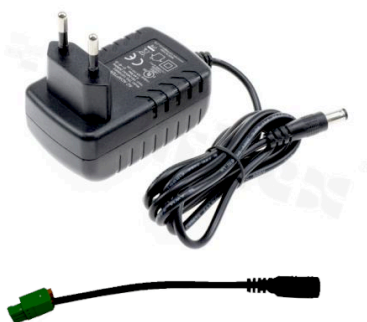
Figure 4.1. Zasilacz dogniazdkowy 24V wraz z adapterem. Kod P/N: SUPPLY-24V-PLUG-ADAPTER