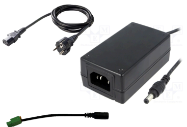
Figure 4.2. Zasilacz modułowy 24V z kablem 1,5m oraz adapterem. Kod P/N: SUPPLY-24V-DESKTOP-ADAPTER